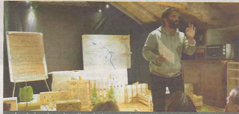
Les trois acteurs lors d'une lecture au sein du relais de l'Espinass à Ventalon

rêve général" : « Ce ne sera pas un spectacle classique mais un moment d'échange avec du son, des instruments de musique et ce sont eux qui animeront les marionnettes. On l'organisera durant des journées de la parentalité au cours desquelles on leur posera des questions par exemple sur leur école idéale » explique Laurélie.